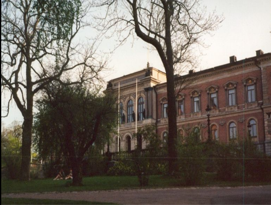
Главное здание Упсальского университета