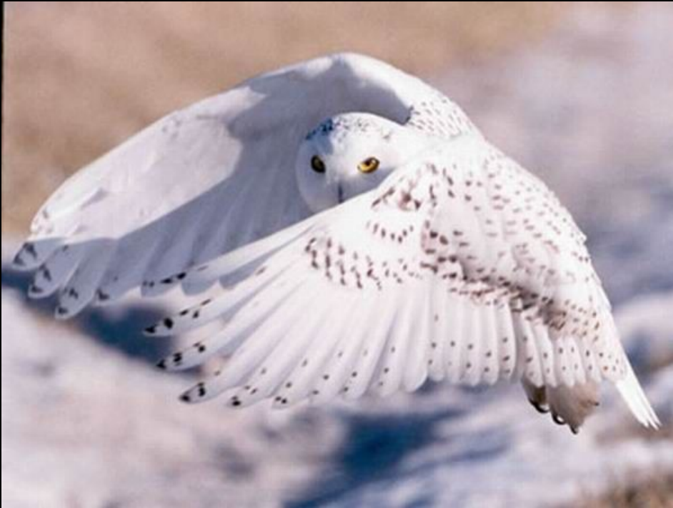
вид сова полярная

1. Развитие представлений о ВИДЕ – вид реально существующая группа организмов, по представлениям данного учёного