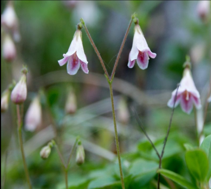
вид Линнея северная (растение названо в честь К. Линнея)