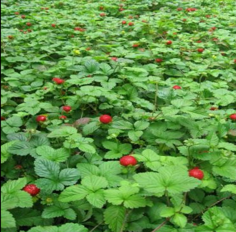
вид земляника лесная описан Карлом Линнеем

2. Описал около 8000 видов растений и 4000 видов животных, разработал первые критерии вида