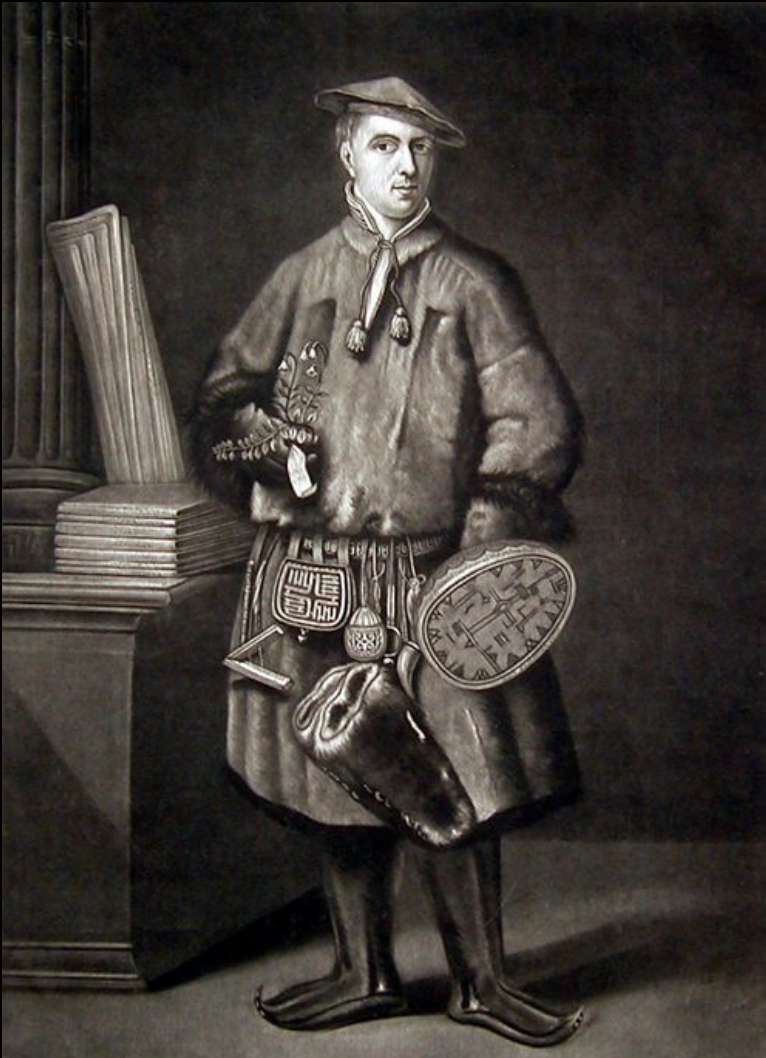
Линней в лапландском костюме 1737 год

1735 год – получена степень доктора медицины; смотритель коллекций и ботанического сада Амстердама (Голландия)