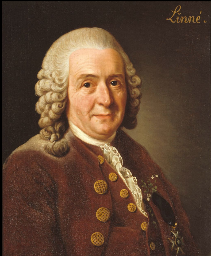
Карл Линней портрет работы Александра Рослина 1775 год