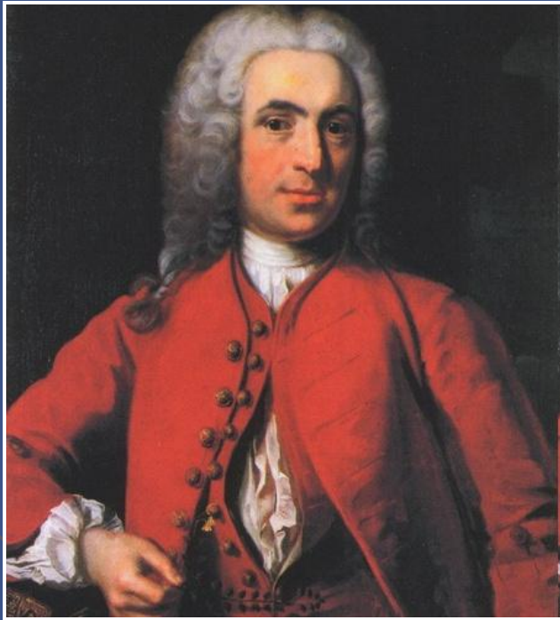
Карл Линней, 1707-1778