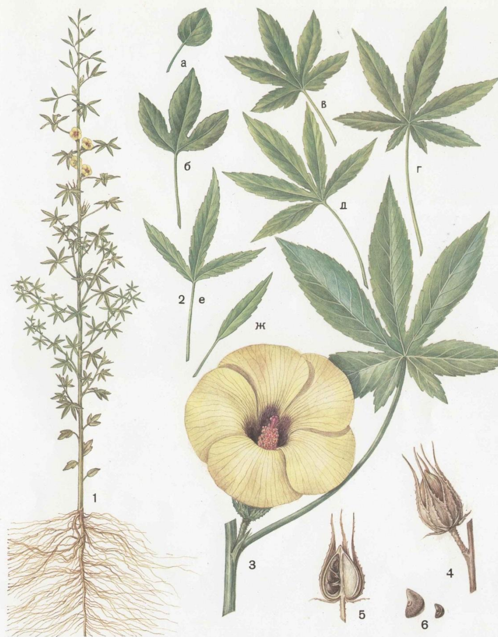
КЕНАФ (стр. 146). 1 — цветущее растение; 2 а, б, в, г, д, е, ж — листья в соответствии с положением на стебле (снизу — вверх); 3 — часть стебля с цветком и листом; 4 — зрелый плод; 5 — плод в разрезе; 6 — семена (слева — увеличенное).

Цветок кенафа 5-лепестковый (диаметр 7-12 см), расположен в пазухе листа на короткой (5-7 мм) цветоножке. Чашечка цветка 5-раздельная. Окраска венчиков кремовая, белая или бледно-сиреневая с ярким вишнево-красным пятном у основания. Лепестки срастаются у основания с тычиночной колонкой, образуя камеру, в которой размещена 5-гнездная завязь с тонким пестиком длиной до 2,5 см. Пестик вверху разделяется на 5 нитевидных рылец с головчатыми утолщениями. Многочисленные