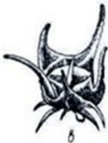
Рис. 188. Кенаф: а — закрытая коробочка; б, в — раскрывшиеся коробочки; г — семена.