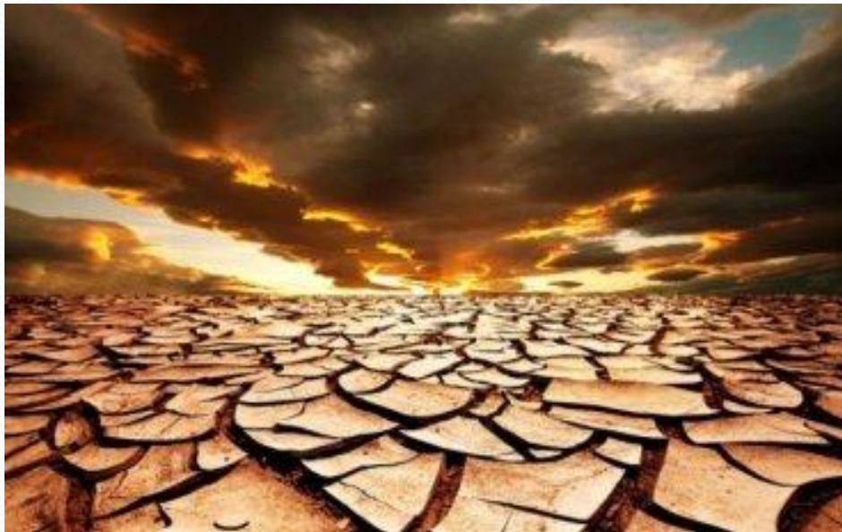
Земля без кислорода

Предположительно, по мнению ученых, на молодой, только созданной планете Земля кислорода практически не было. Он начал создаваться путем развития жизнедеятельности фотосинтезирующих организмов.