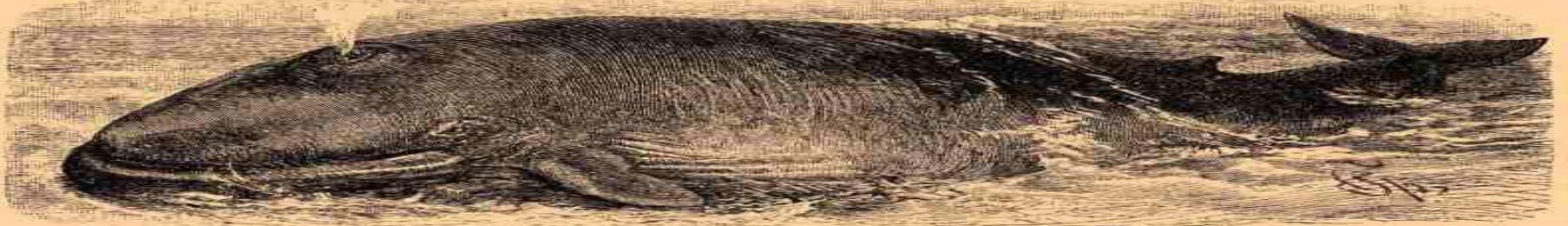
3. Обыкновенный полосатикъ, финвалъ (Balaenoptera musculus).