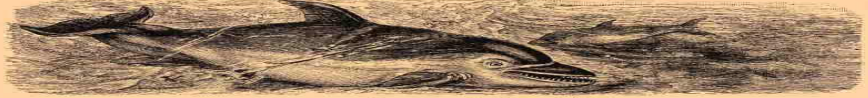
2. Обыкновенный дельфинъ (Delphinus delphis).