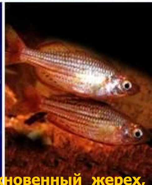
Верхний ряд – карпообразные, слева направо: обыкновенный жерех, белый амур, обыкновенный вьюн, гольян-красавка. Нижний ряд, слева направо: карпозубообразные (меченосец, четырёхглазка), сарганообразные (двукрылая летучая рыба), атеринообразные (радужная рыбка).