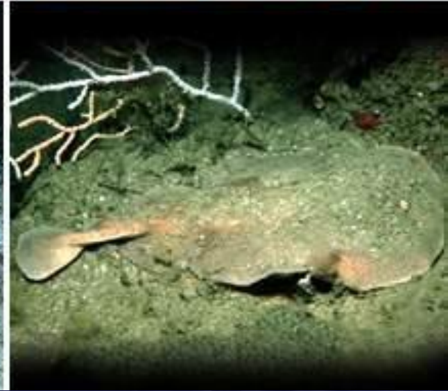
Скаты. Верхний ряд, слева направо: пилорылообразные (обыкновенная пила-рыба), ромботелые (ромбовый скат, пятнистый орляк). Нижний ряд, слева направо: хвостоклообразные (гигантский морской дьявол (манта), американский скат-хвосток), электрические скаты (обыкновенный электрический скат).