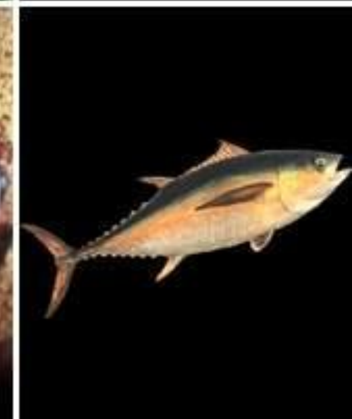
Окунеобразные. Верхний ряд, слева направо: обыкновенный окунь, обыкновенная скумбрия, рыба-брызгун, жемчужный нитеносец. Нижний ряд, слева направо: обыкновенный ёрш, щетинозуб-пинцетник, императорская рыба-ангел, желтопёрый тунец.