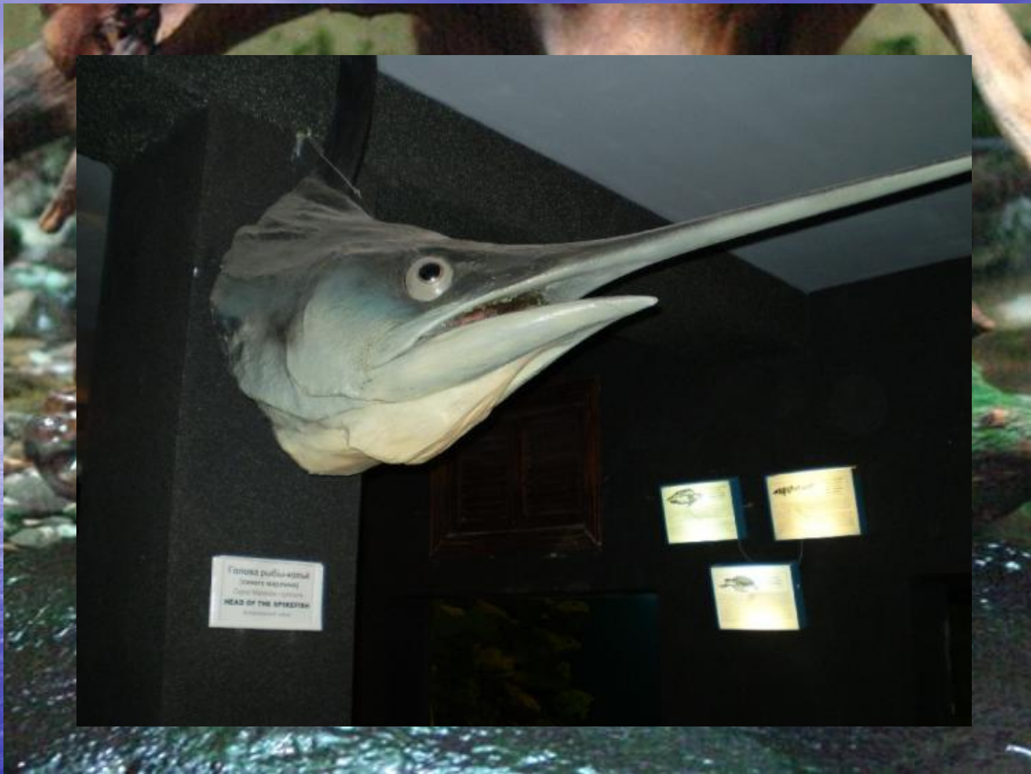
Голый рыба-кошка (Синий маринус) (Squalus marinus) HEAD OF THE SPIKEFIN