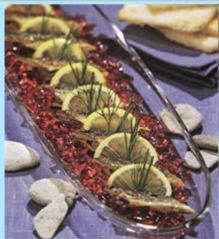
Миного в желе из черной смородины.