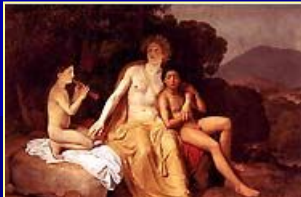
А. А. Иванов. «Аполлон, Гиацинт и Кипарис»