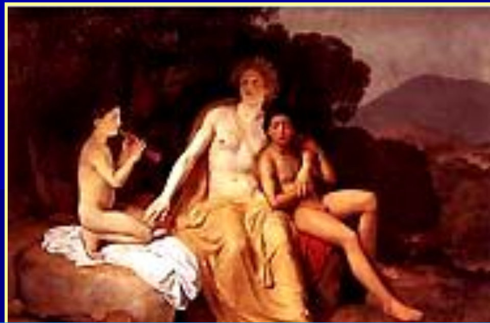
А. А. Иванов. «Аполлон, Гиацинт и Кипарис»