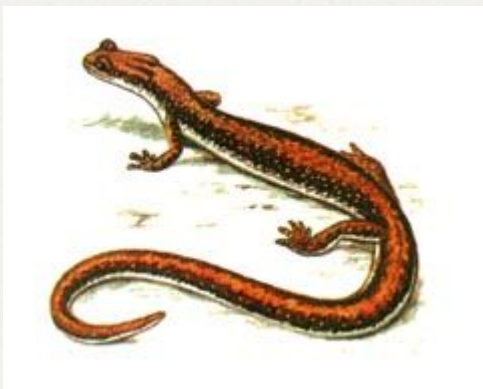
уссурийский когтистый тритон