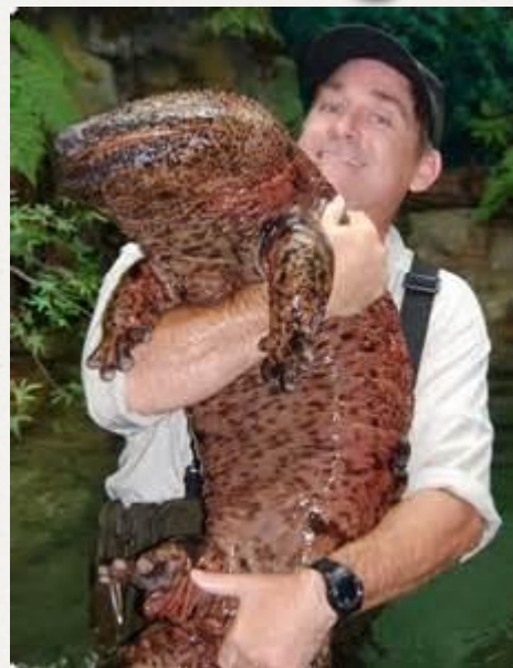
Японская исполинская саламандра