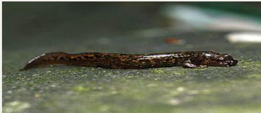
Уссурийский когтистый тритон

У тритона хорошо развита способность к регенерации, но вместо одного органа может вырасти другой.