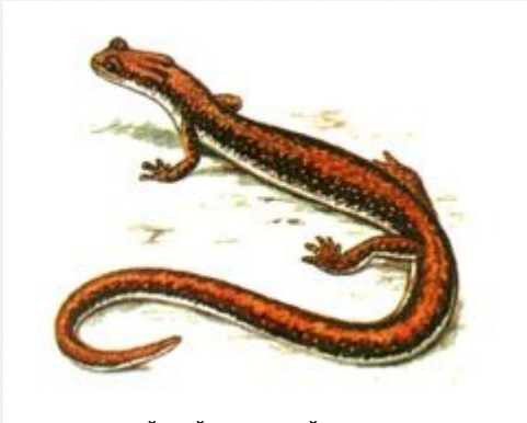
уссурийский когтистый тритон