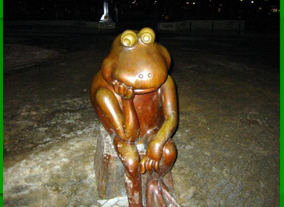
Памятник лягушке в Бостоне