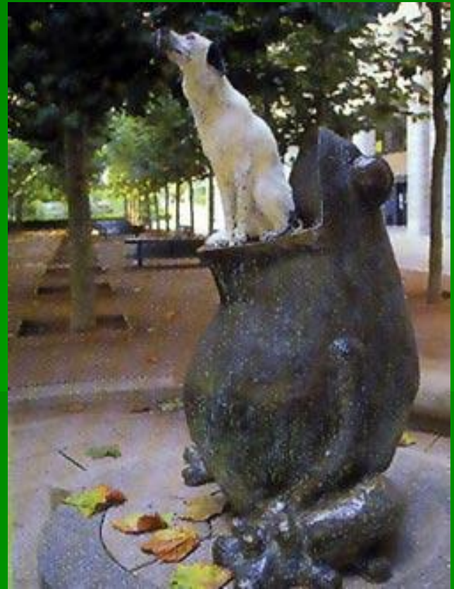
Памятник лягушке возле здания Института Пастера в Париже.