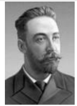
П. Н. Лебедев

Важнейшую роль в выяснении природы света сыграло опытное определение его скорости. Начиная с конца XVII века предпринимались неоднократные попытки измерения скорости света различными методами (астрономический метод А. Физо, метод А. Майкельсона).