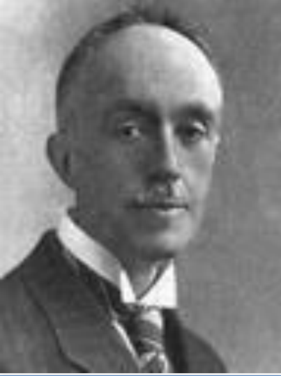
Маркиз Луи де Бройль