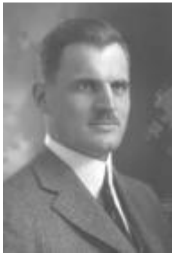
1892. Артур Холли Комптон