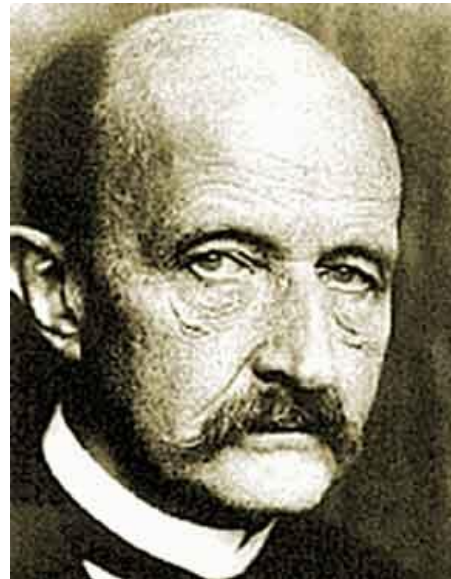
Планк Макс Карл Эрнст Людвиг