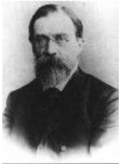
Александр Григорьевич Столетов

При распространении света проявляются его волновые свойства (интерференция, дифракция, поляризация), а при взаимодействии с веществом – корпускулярные (фотоэффект). Эта двойственная природа света получила название корпускулярно-волнового дуализма.