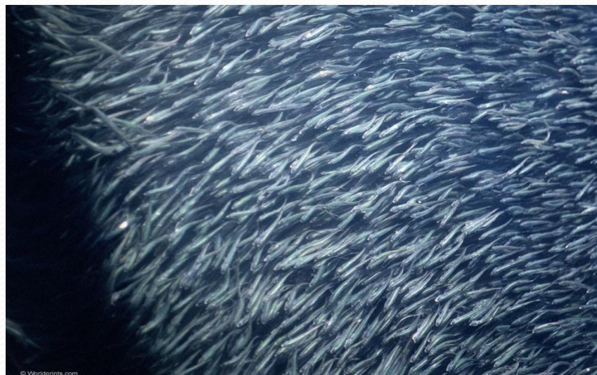
макрель, тунцов, терпугов