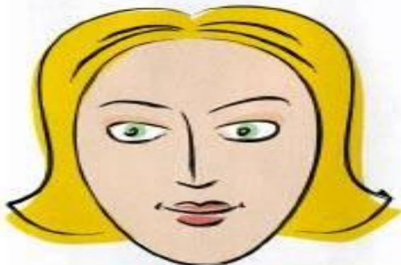
а) сухая кожа