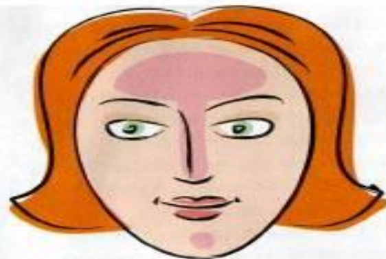
г) комбинированная кожа