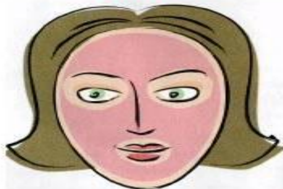
в) жирная кожа