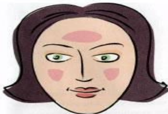
б) нормальная кожа