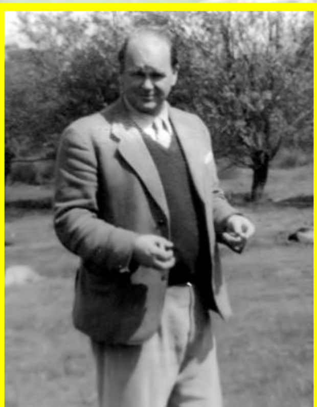
Питер Скотт 1954 год

Красный цвет привлекает внимание и символизирует опасность. Броское название «Красная книга» предложил Питер Скотт, сын знаменитого полярного исследователя Роберта Скотта возглавлявший Комиссию до 1978 г.