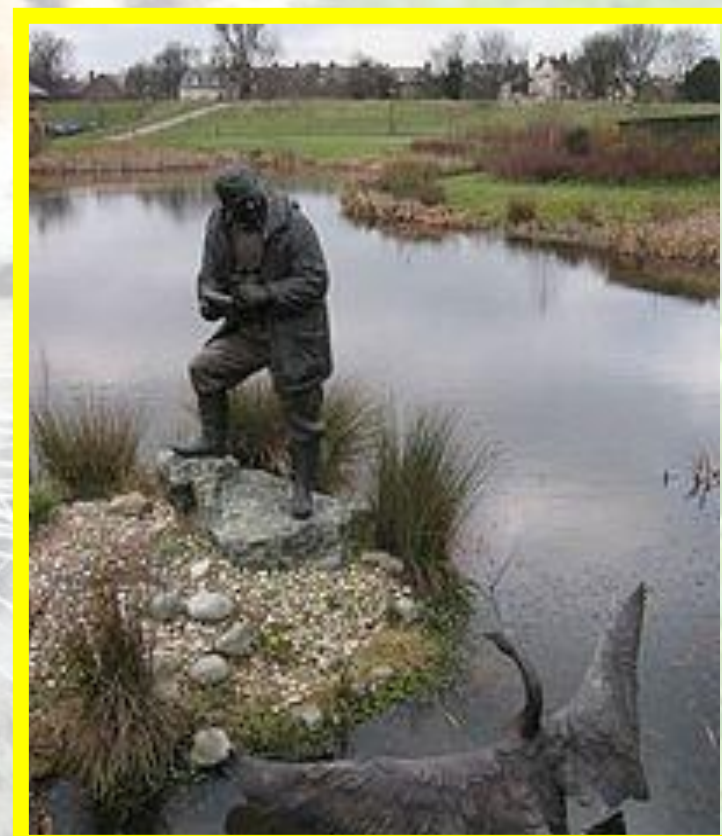
Памятник Питеру Скотту