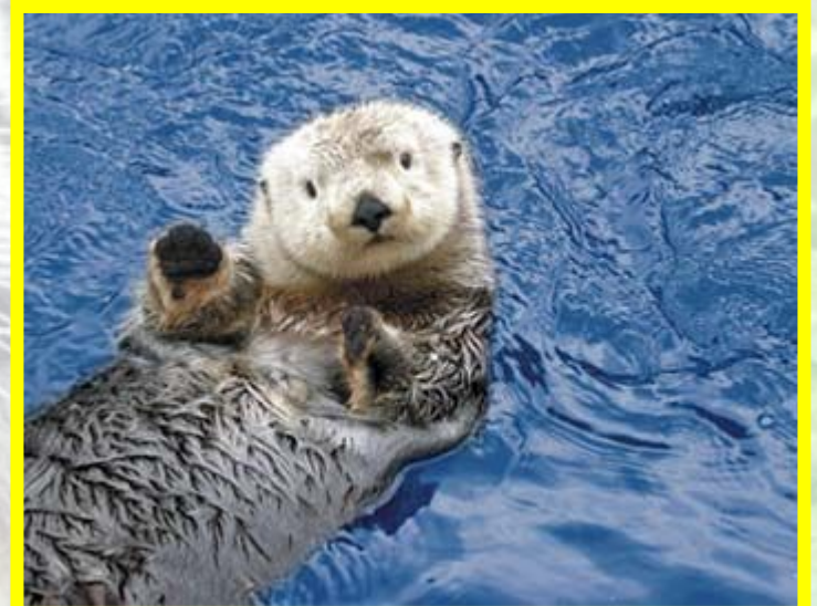
Калан или морская выдра