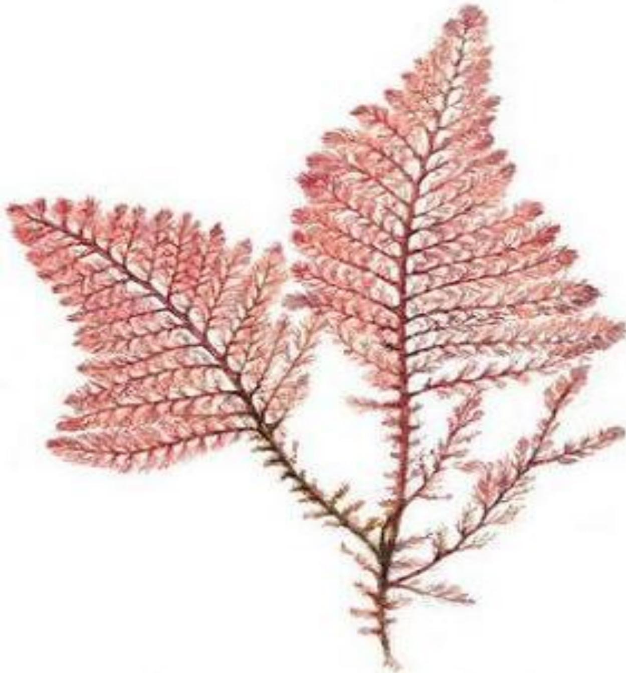
Красные водоросли. Дазия (Dasya).