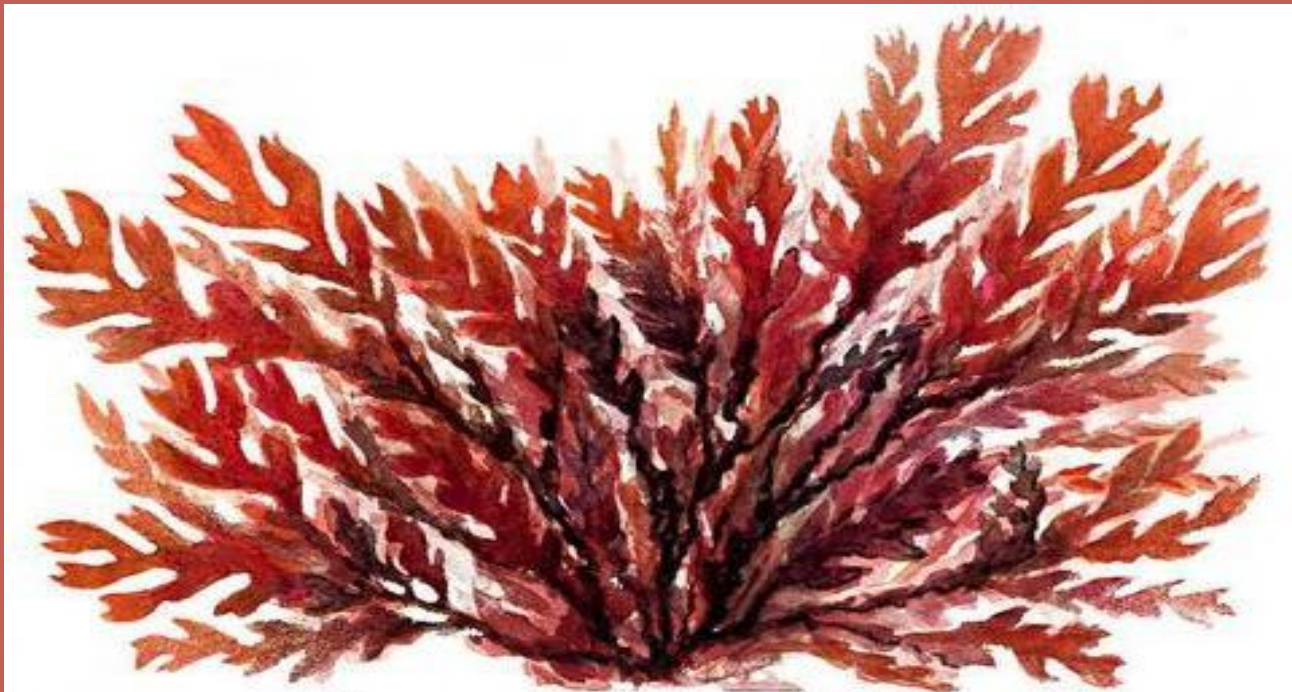
Красные водоросли. Одонталия (Odontalia).