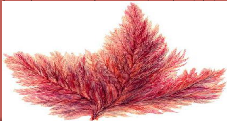
Красные водоросли. Каллитамнион (Callithamnion).

Красные водоросли обитают преимущественно в морях (часто на большей глубине, чем зелёные и бурые водоросли, что обусловлено присутствием фикоэритрина, способного, по-видимому, использовать для фотосинтеза зелёные и синие лучи, проникающие глубже других в воду), меньше в пресных водах и почве. Ископаемые красные водоросли найдены в отложениях мелового периода. Наибольшее практическое значение имеют анфельция, гелидиум, филлофора, фурцеллярия, дающие студнеобразующие вещества — агар-агар, агароид, карраген. Некоторые красные водоросли, например порфира, употребляются в пищу.