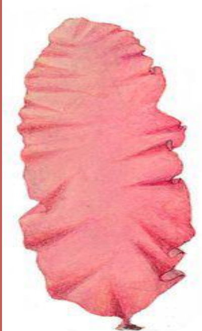
Красные водоросли. Порфира (Porphyra).