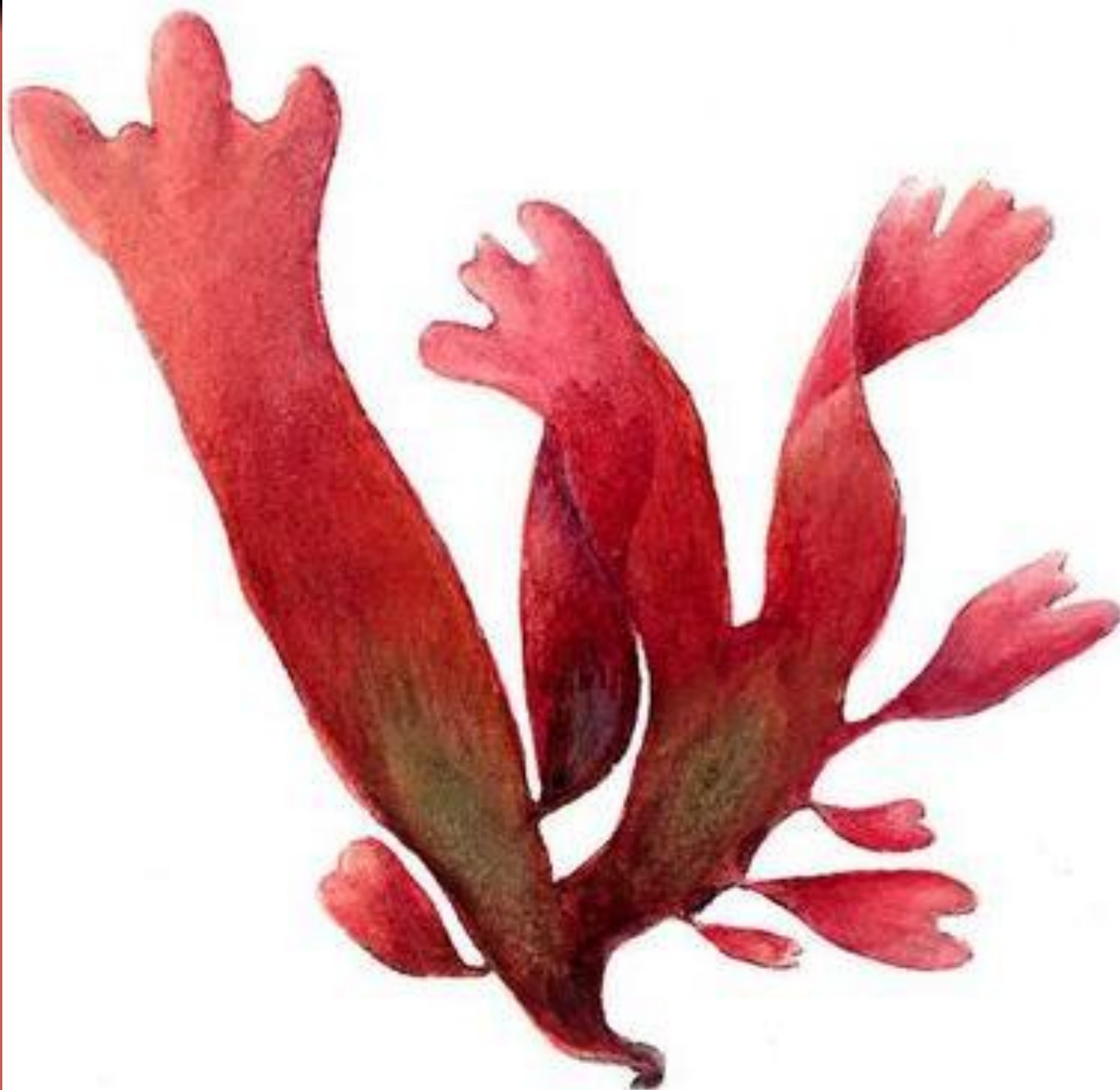
Красные водоросли. Родимения ( Rhodymenia ).