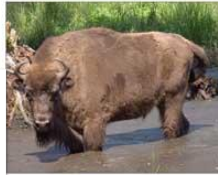
Ареалы расселения зубра в Центральной России и на Кавказе