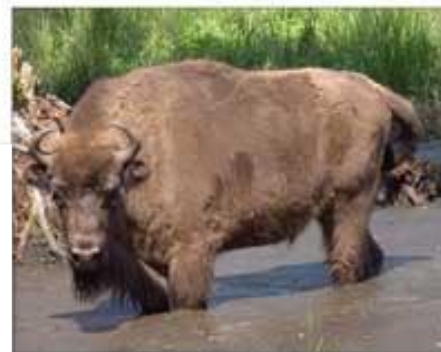
Ареалы расселения зубра в Центральной России и на Кавказе