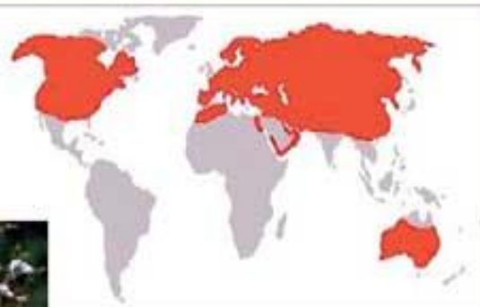
Ареал распространения лисицы