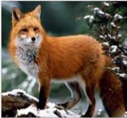
Ареал распространения лисицы