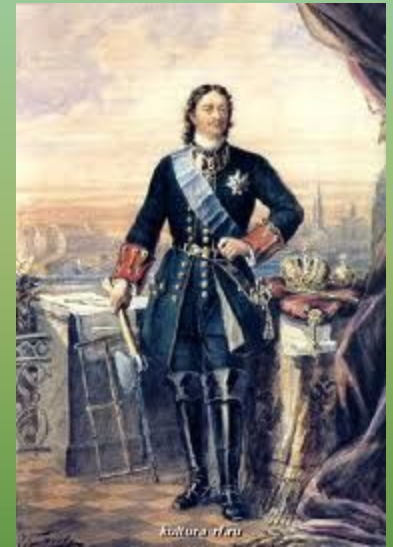
Первый российский император

Пётр Первый издал Указ о повсеместном выращивании этого овоща, называемого в ту пору у нас " земляным яблоком ".