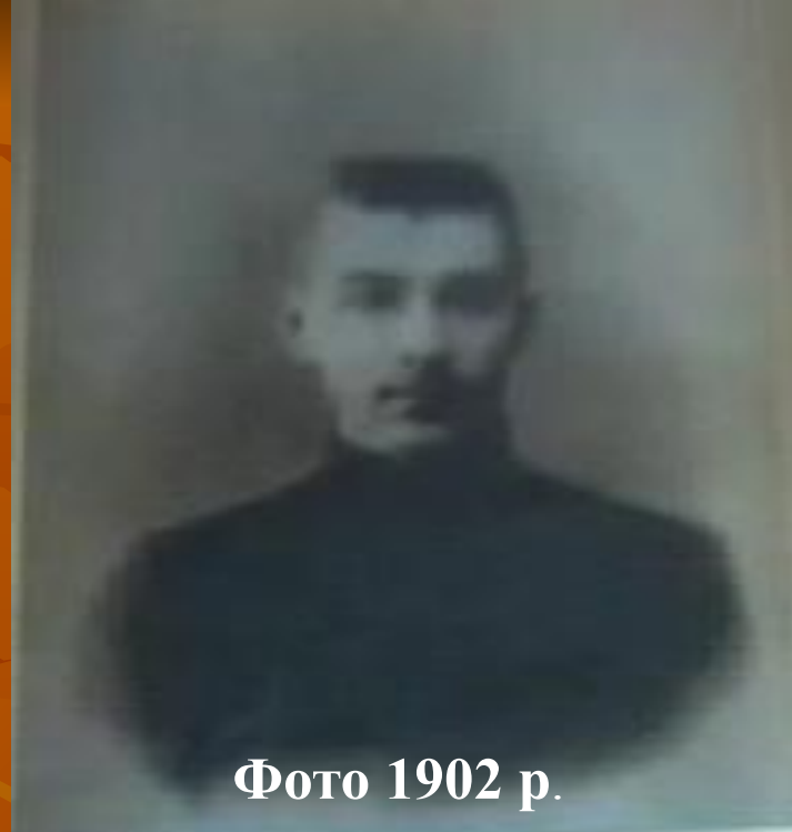
Фото 1902 р.

1900р. екстерном складає іспити у Златопільській гімназії і вступає на юридичний факультет Київського університету.