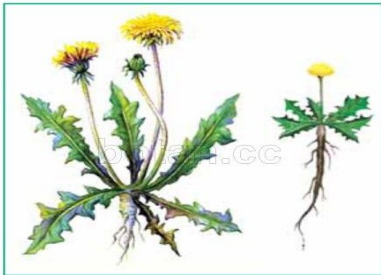
Рис. 103. Равнинная и горная формы одуванчика