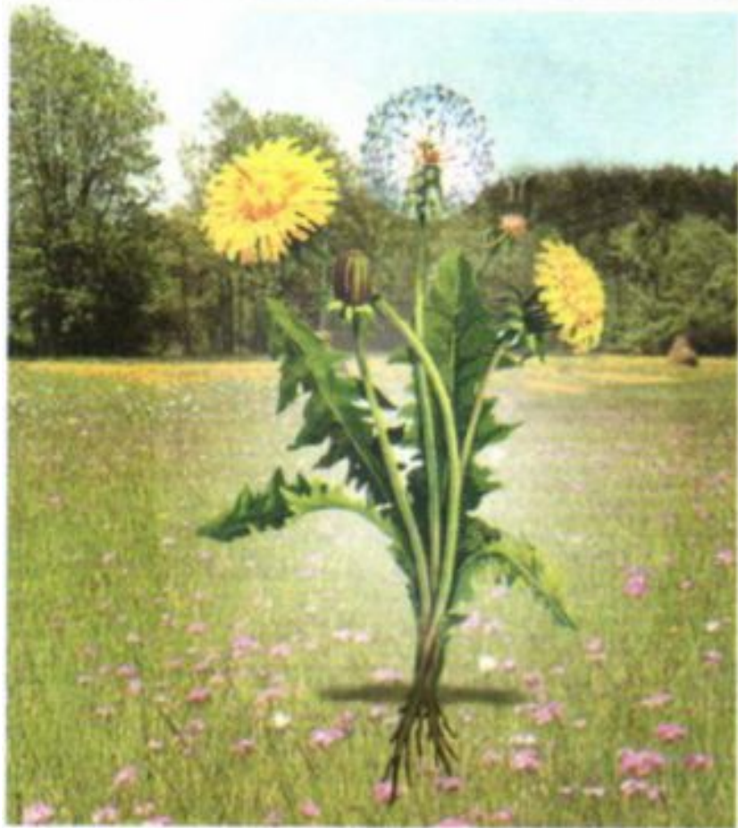
Растение, выросшее в низине