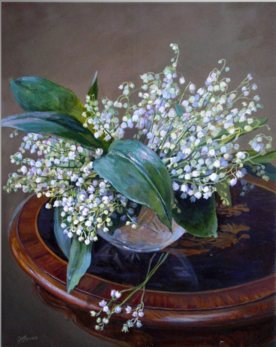
Панов Эдуард. Ландыши на столе.

Дугою стебелёк, и лист как одеяло... А под дугой цветы, как капельки тумана... Беззвучных колокольчиков волною аромат... Весенней феей высажен в лесу волшебный сад.