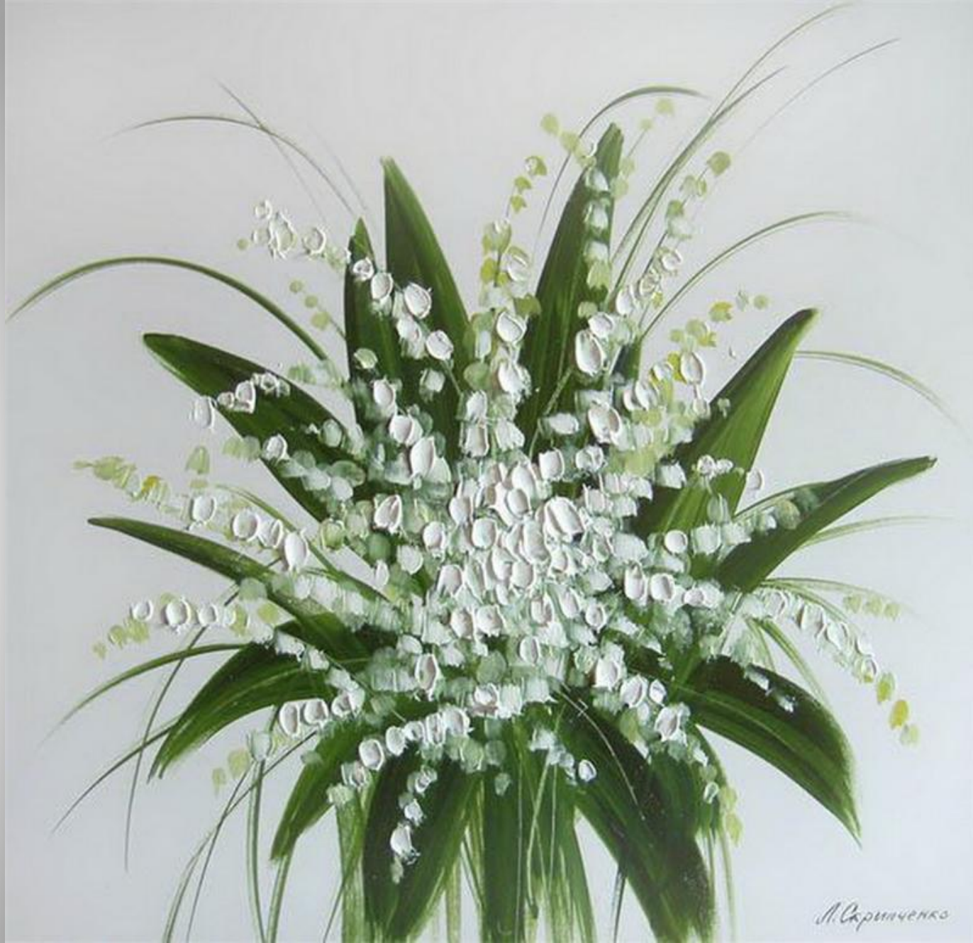
Людмила Скрипченко. Ландыши.