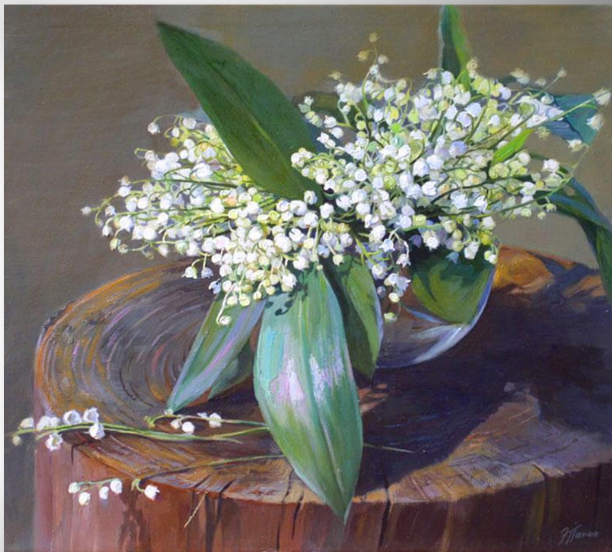
Панов Эдуард. Ландыши.