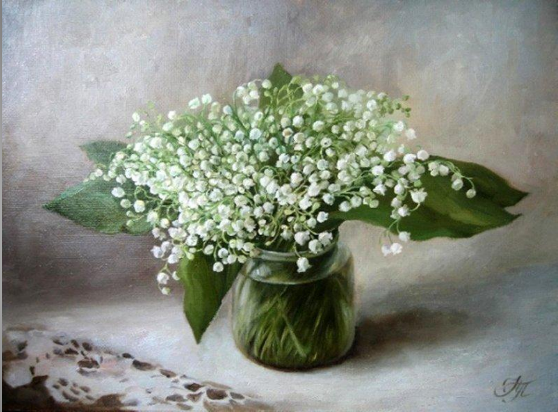
Познихир Н.Н. Ландыши.