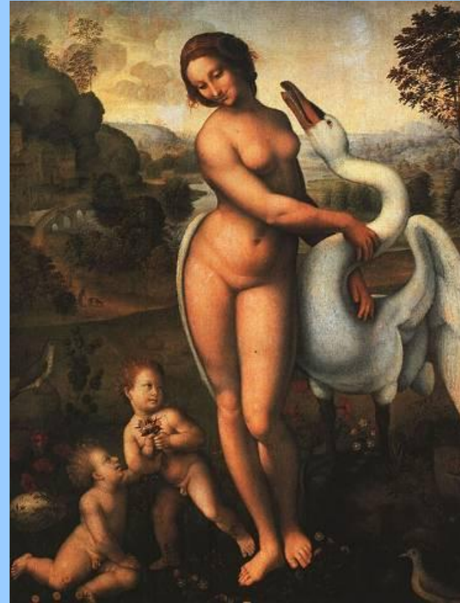
Леда с лебедем. Леонардо да Винчи