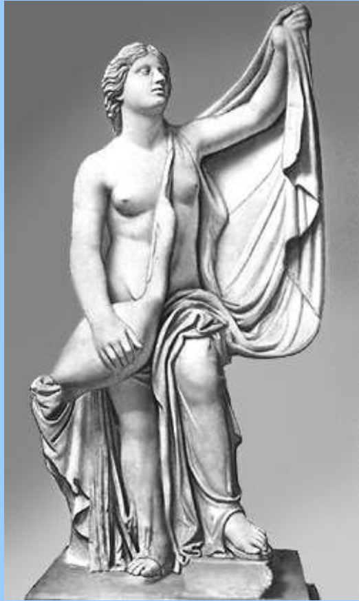
«Леда с лебедем». Римская мраморная копия с греческого оригинала скульптора Тимофея. 4 в. до н. э. Вилла Альбани. Рим.

Жена спартанского царя Тиндарея, Леда, покорила своей красотой верховного бога Зевса, который сочелся с ней в образе лебедя. От этого союза Леда родила яйцо, из которого появилась Елена – получеловек, полу – лебедь. Елена отличалась чарующей красотой, за что её похитил Парис, дав повод к Троянской войне.