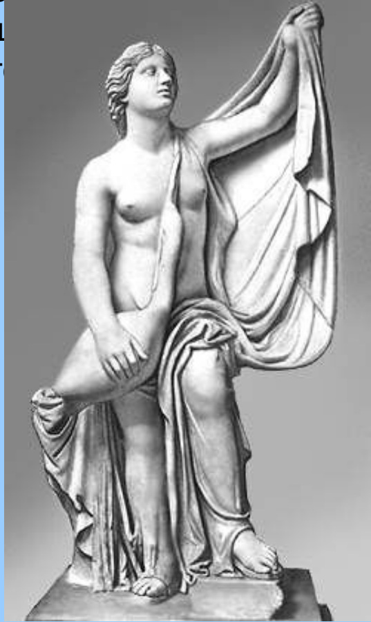
«Леда с лебедем». Римская мраморная копия с греческого оригинала скульптора Тимофея. 4 в. до н. э. Вилла Альбани. Рим.