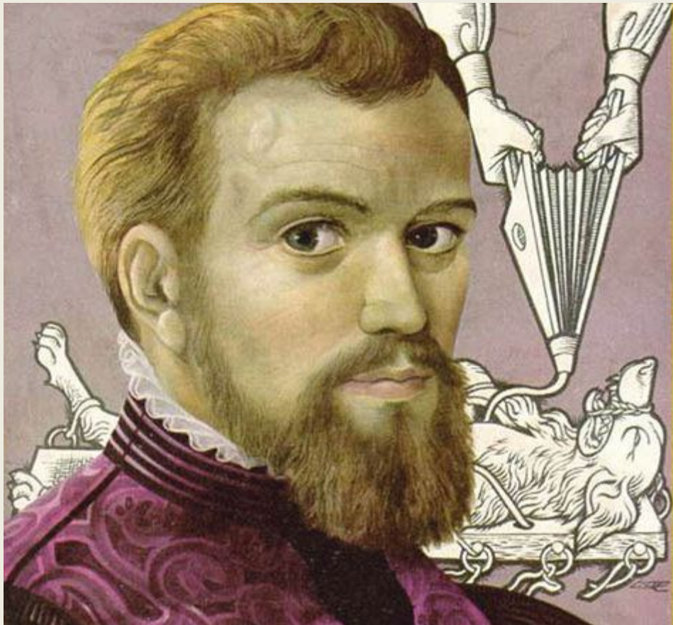
Андреас Везалий (1514 - 15640)

В своей медицинской практике использовал до 180 снадобий основанных на вытяжках и составных частях лекарственных растений.