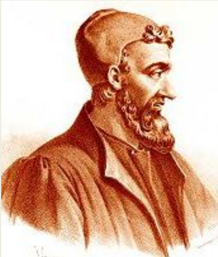
Клавдий Гален (129 - 201 )

Римский врач Клавдий Гален , положивший основу аптекарской науки – фармакологии.