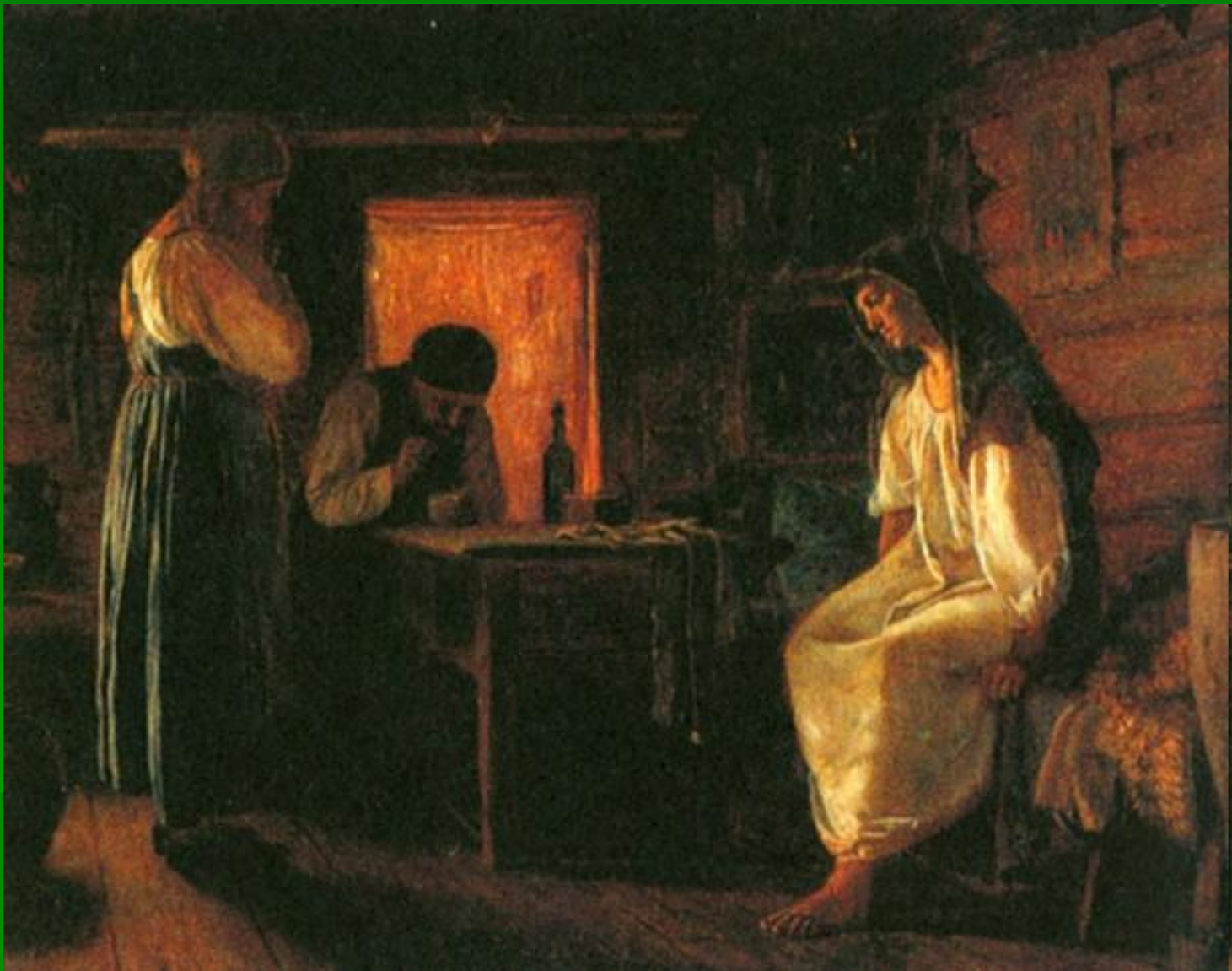
Знахарки на Руси