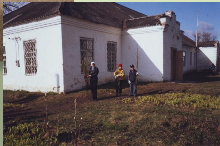
Благоустройство и озеленение территории школы.