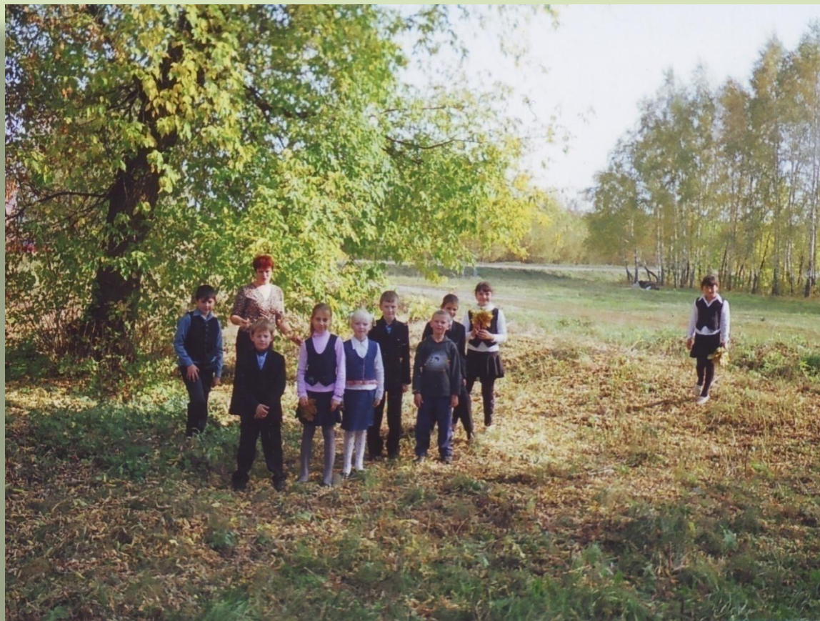
Экскурсия «Удивительное рядом»