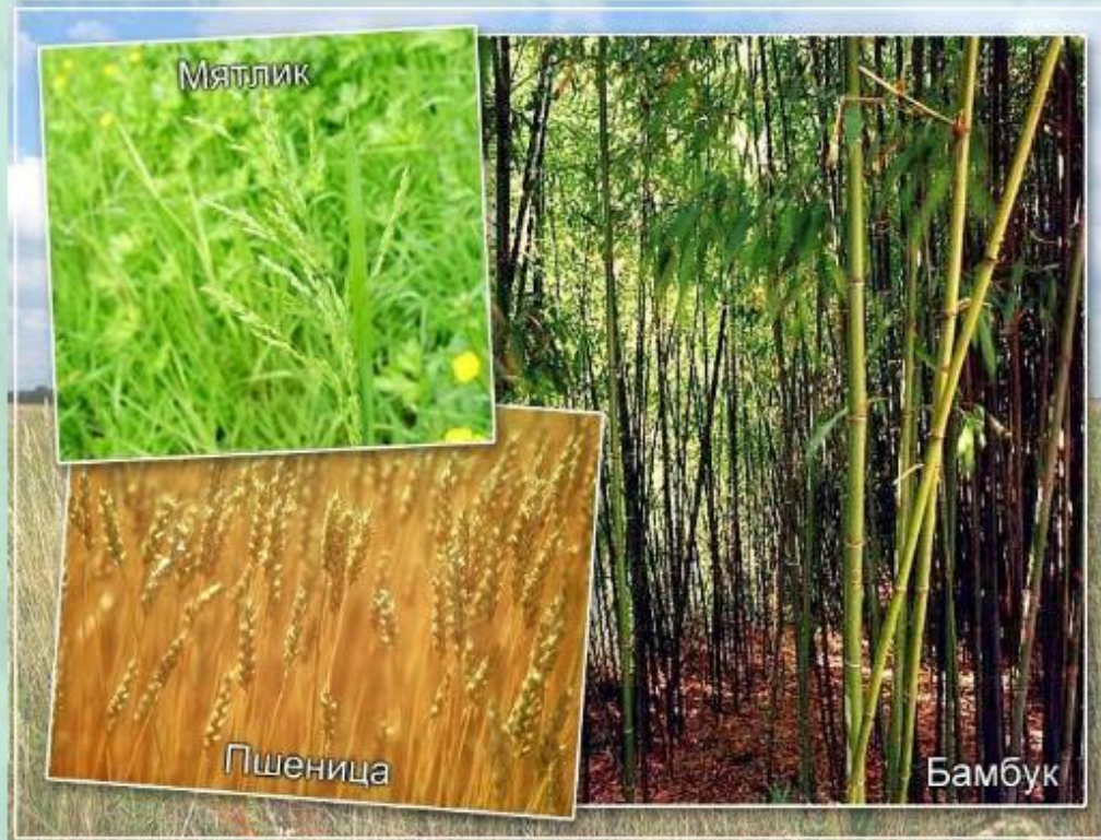
Растения семейства злаковых.

Помимо семейства лилейных, мы рассмотрим особенности растений семейства злаковых . Это одно из самых крупных семейств среди цветковых растений. В его состав входит более 10 000 видов растений.