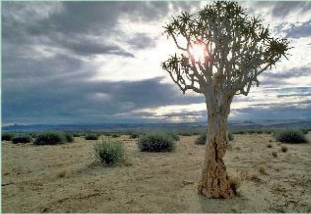
Дикорастущее алоэ в пустыне Карру (Африка).

Совсем не похоже на своих сородичей по семейству лилейных такое растение, как алоэ (его еще называют столетником). У алоэ мясистые сочные листья, в которых содержится много полезных веществ. Сок листьев алоэ используют как лекарство.