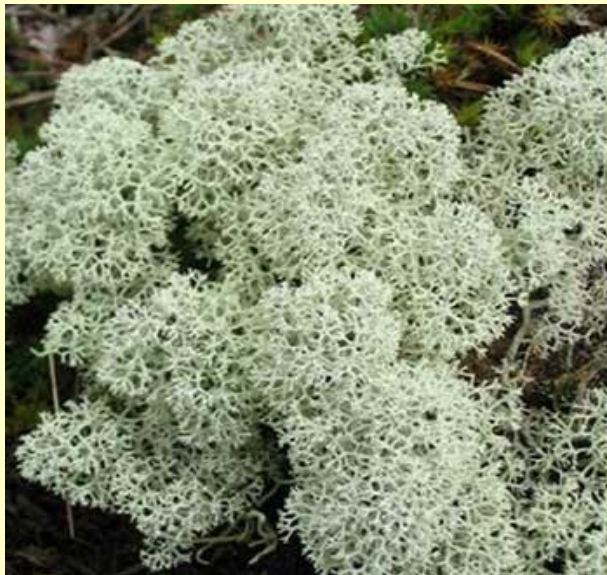
Ягель – олений мох