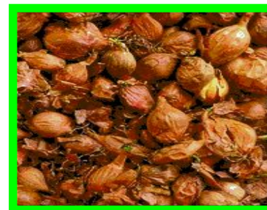
Лук - шалот