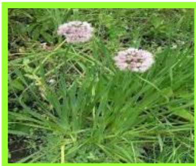
Лук - слизун