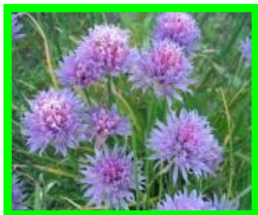
Лук - шнитт