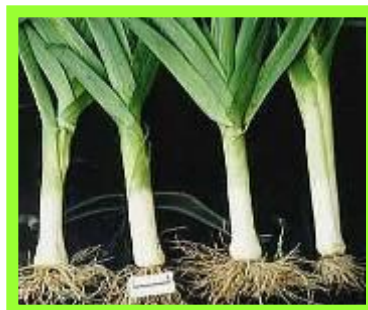
Лук - порей