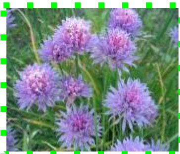
Лук - шнитт