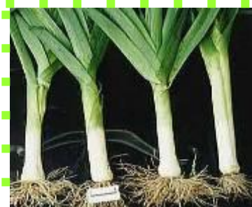
Лук - порей