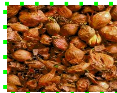
Лук - шалот