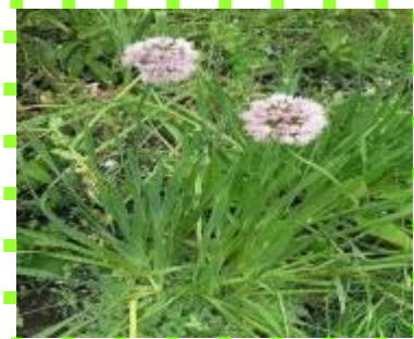
Лук - слизун