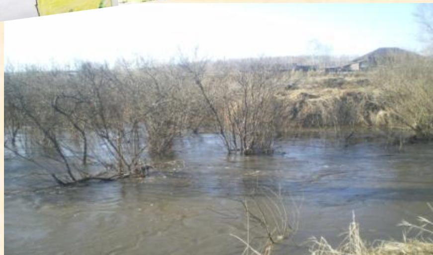
ПАВОДОК НА РЕКЕ БЕЛОЙ