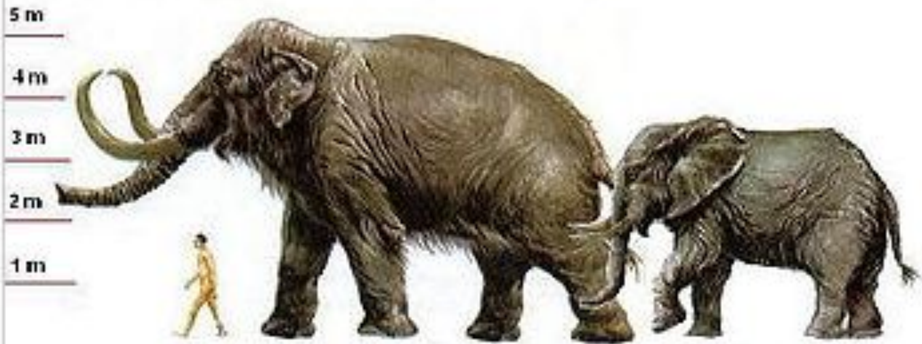
Сравнительные размеры мамонта, современного африканского слона и человека