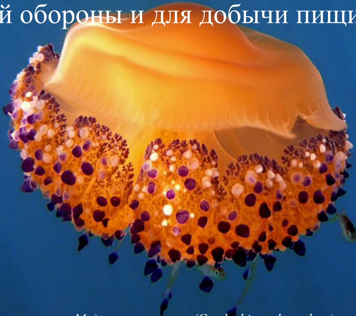
Медуза котилориза (Cotylorhiza tuberculata)

В стрекательных клетках содержится «обжигашее» вещество, служащее для целей обороны и для добычи пищи.