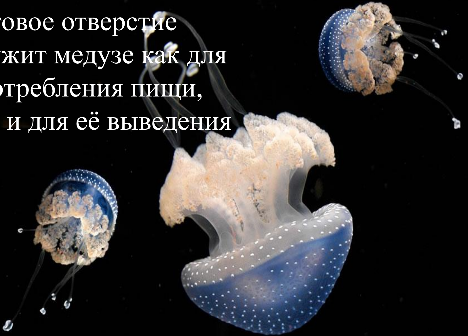
Пятнистая австралийская медуза (Phyllorhiza punctata)

Ротовое отверстие служит медузе как для употребления пищи, так и для её выведения