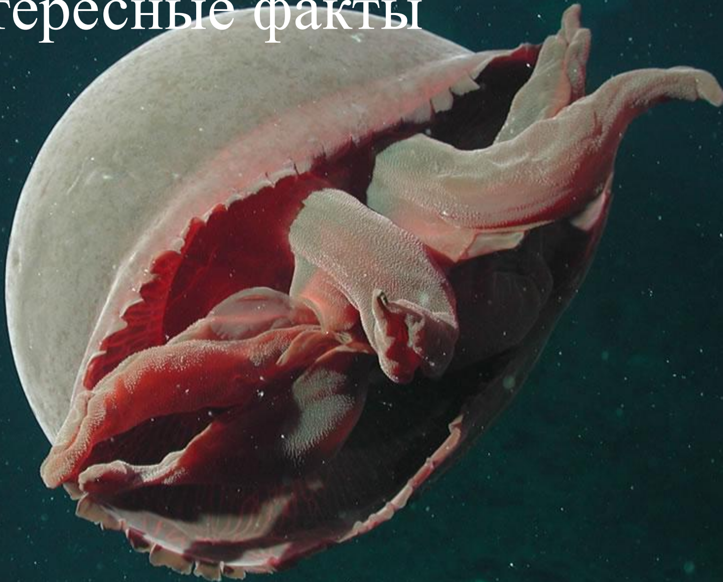
Большая красная медуза