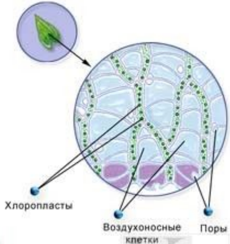
Клеточное строение листа сфагнума