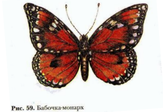
Рис. 59. Бабочка-монарх