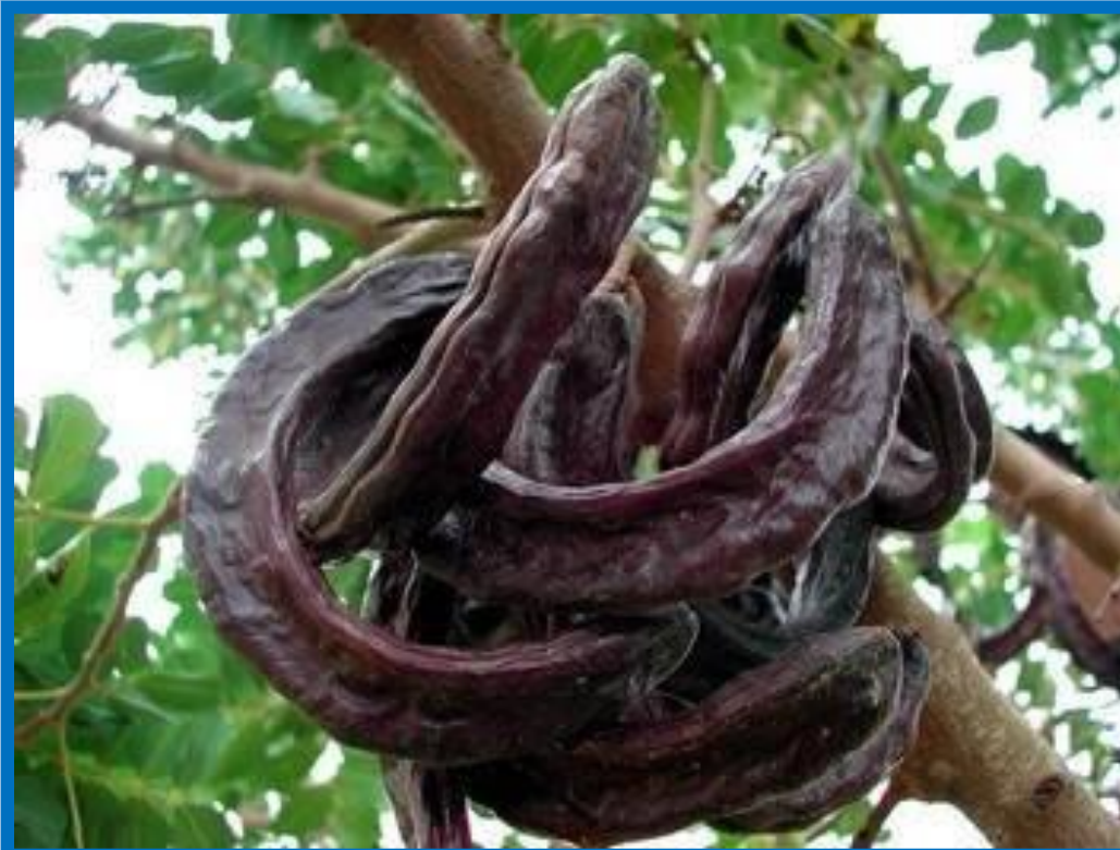
Плоды рожкового дерева

В процессе эволюции плоды появились для обеспечения сохранности и успешного распространения семян.