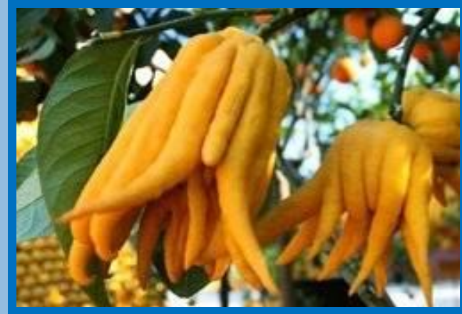
Цитрус рука Будды