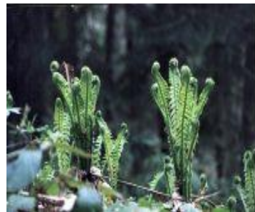
Папоротник Щитовник мужской