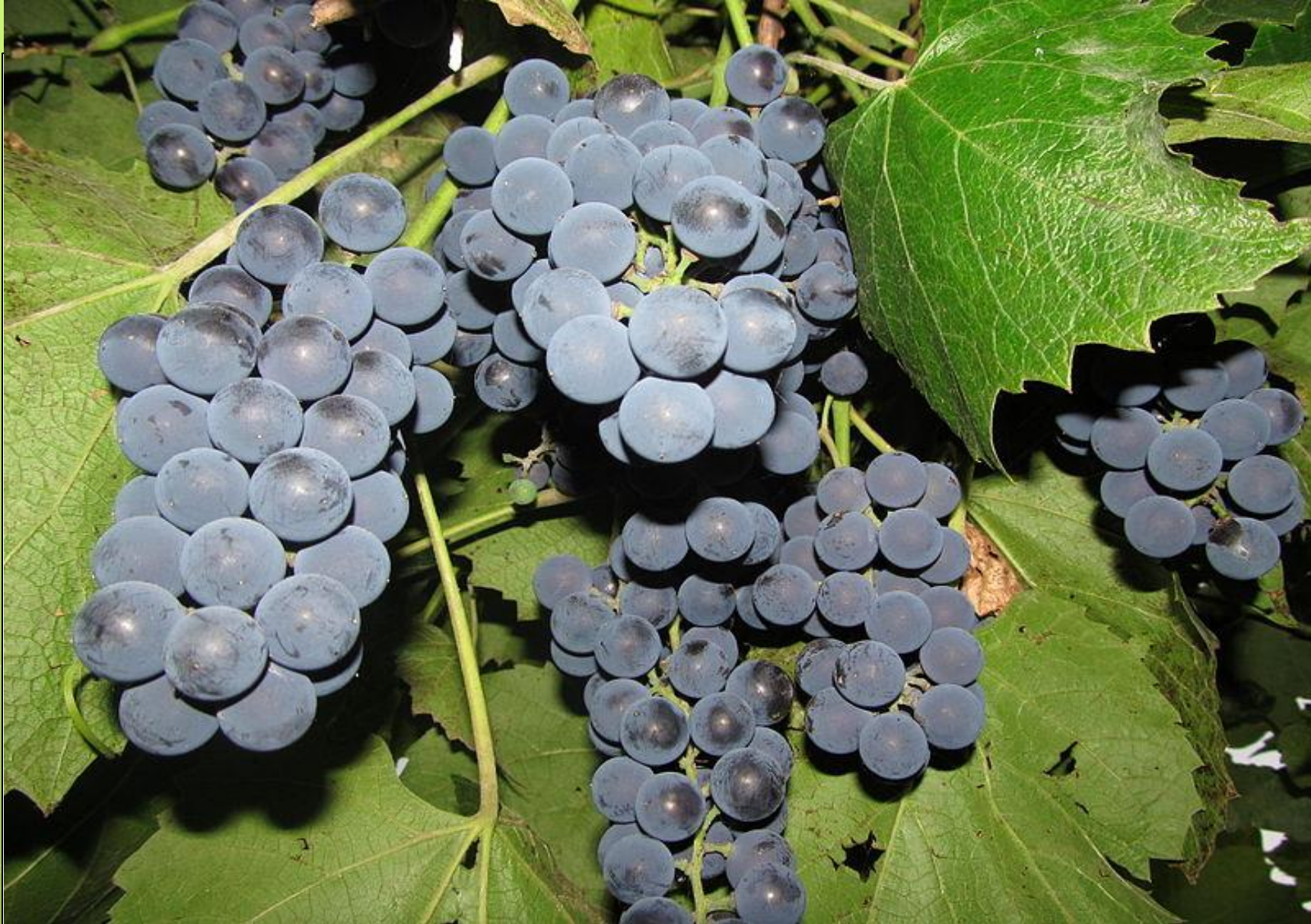
Плоди і листя винограду