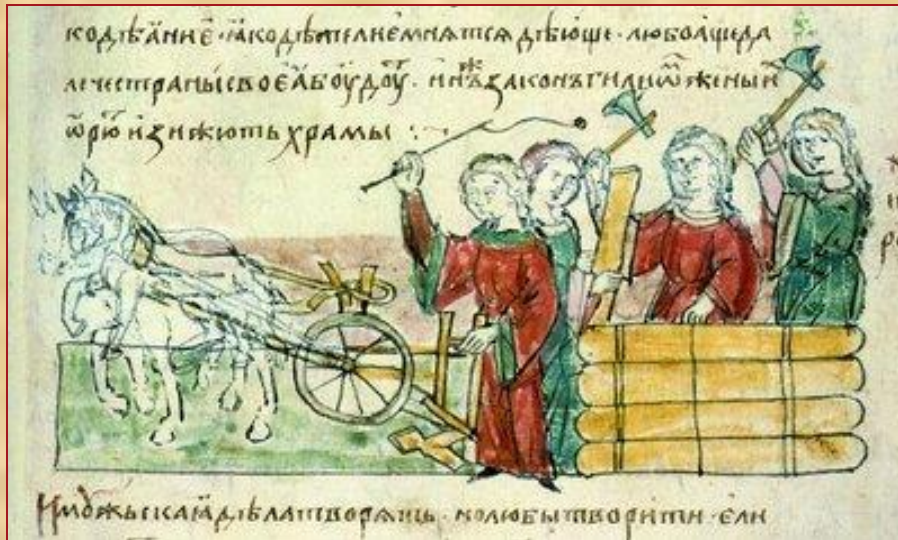
Возведение стен и распашка земель. Миниатюра из Радзивильской летописи. XV в (БАН.34.5.30.Л.7)