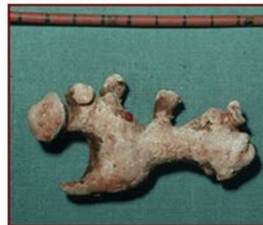
Коралловидный камень почки