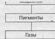
Рис. 5.1. Компоненты молока