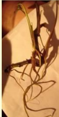
Образование придаточных корней на черенке сингониума