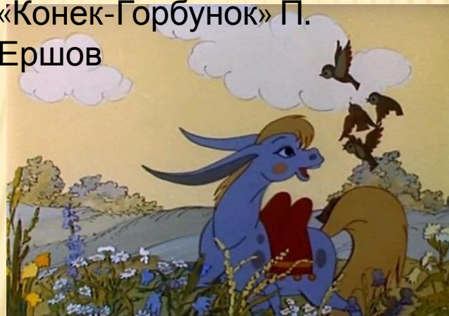
«Конек-Горбунок» П. Ершов

Конное дело всегда было частью человеческой культуры. С лошадьми связано множество примет, мифов, легенд и сказок, народных песен и стихотворений, произведений живописи и скульптуры.