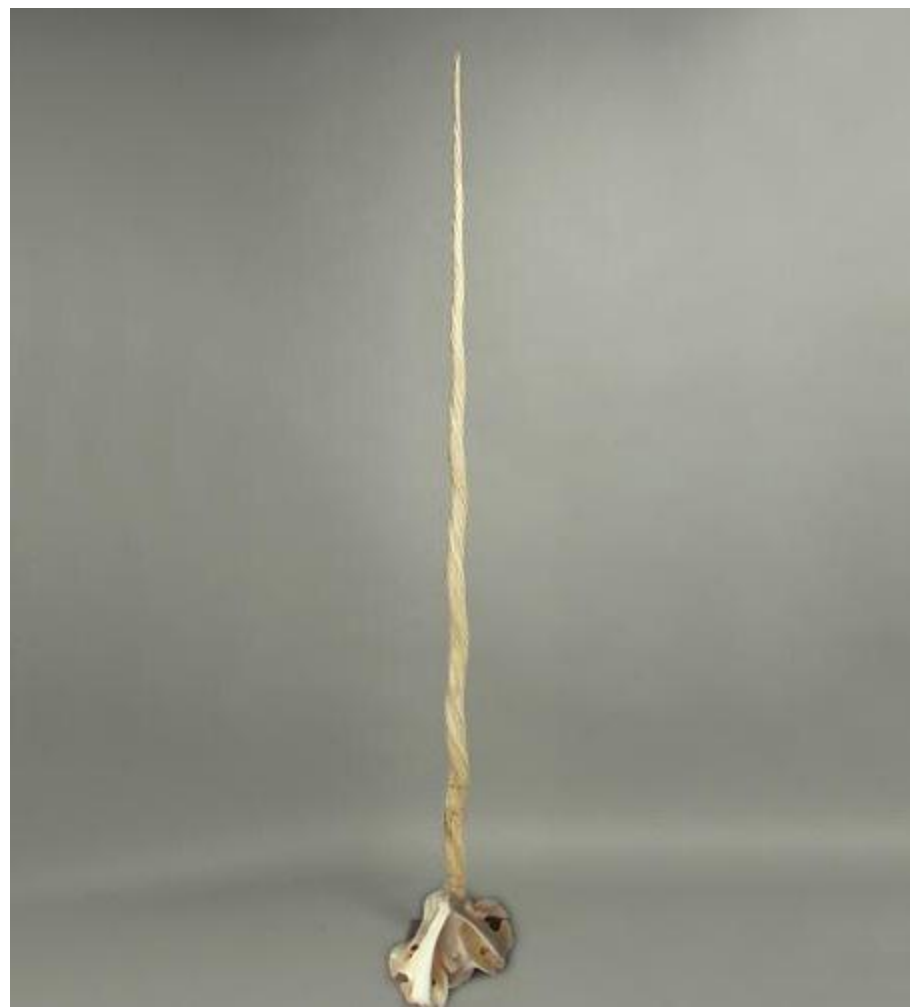
Фото коллекция Зуб нарвала