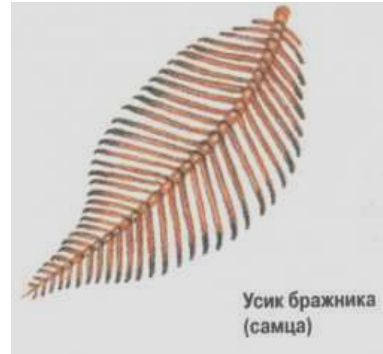
Усик бражника (самца)