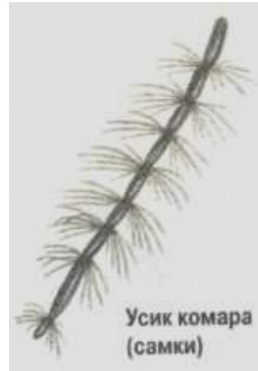
Усик комара (самки)