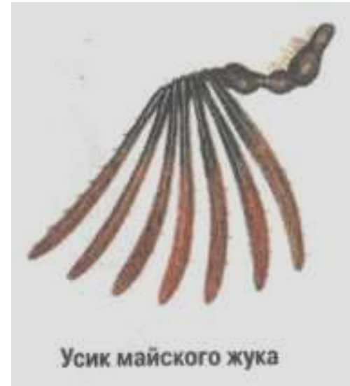
Усик майского жука