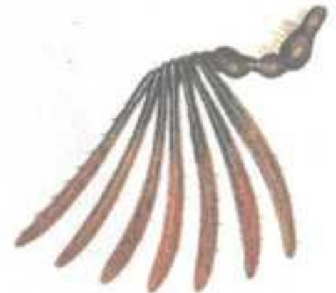
Усик майского жука