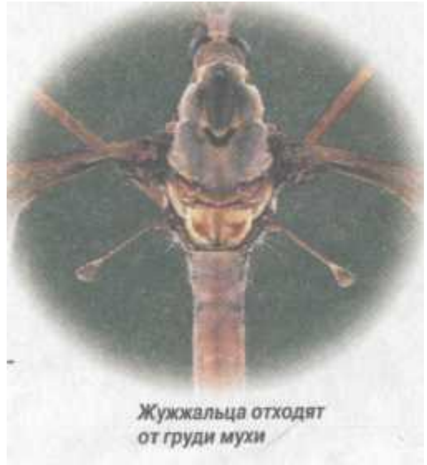
Жужжальца отходят от груди мухи