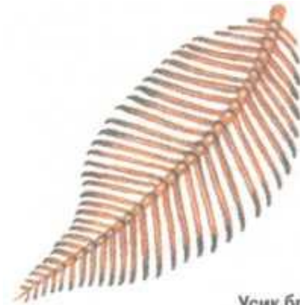
Усик бражника (самца)