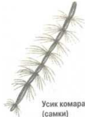
Усик комара (самки)