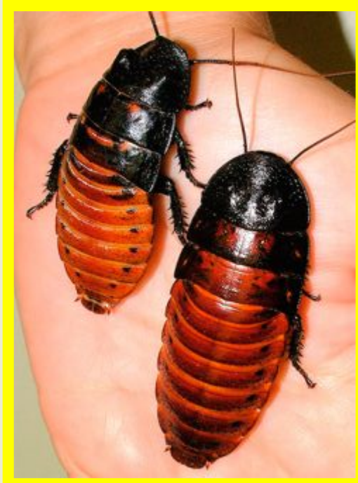
Мадагаскарский шипящий таракан

Они существуют на Земле уже 350 миллионов лет.