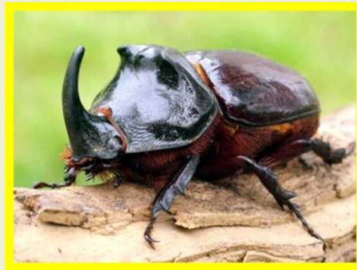
Жук - геркулес

Известно более четверти миллиона видов жуков, но еще много видов будет открыто наукой. Эти животные живут во всех средах обитания, и благодаря мощному грызущему ротовому аппарату питаются любым кормом. Большинство жуков - летающие насекомые.