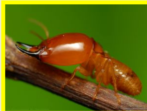
Термит - приведение