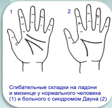
Сгибательные складки на ладони и мизинце у нормального человека (1) и больного с синдромом Дауна (2)